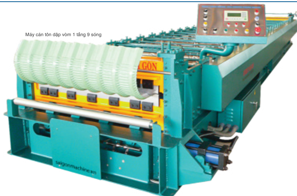
Máy cán tôn dập vòm 1 tầng 9 sóng