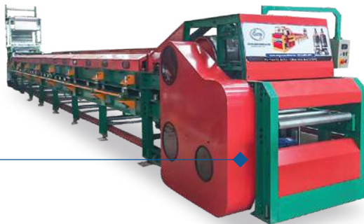
Dây chuyền PU nâng hạ K914