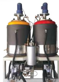
Trạm phun PU