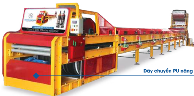
Dây chuyền PU nâng hạ K1200